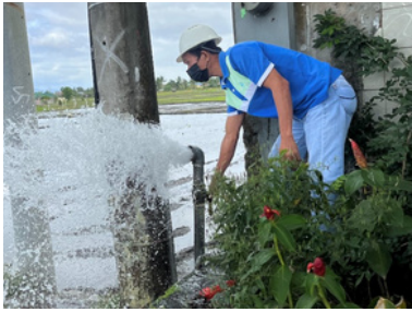
Paglilinis ng suplay ng tubig sa pamamagitan ng flushing sa Brgy. Masiit, Calauan, Laguna.

588-8331, 538-4227, 538-3752 +6388 988 3753, +6388 538 4227 larc.mails@larc.com.ph www.larc.com.ph Facebook, Twitter, YouTube, Instagram icons