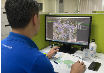
LARC employee monitoring the LARC Quantum Geographic Information System (QGIS).

LARC continuously finds ways to efficiently manage the water system in its service area. As of the last quarter of 2022, ninety-four percent of customer water meters were digitalized through geotagging. Geotagging is the process of adding geographic coordinates to media based on the location of a mobile device. The technology is being utilized by LARC to effectively update their database based on media, such as photos and videos, sent by the field workers.