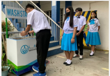
Nicolas Galvez Memorial Integrated National High School (MINHS) students using the wash station donated by LARC.

On October 18, 2022, LARC officially turned over one wash area for Nicolas Galvez Memorial Integrated National High School (MINHS) and another for Sto. Domingo Elementary School. This is in line with the celebration of Global Handwashing Day, an annual global advocacy day dedicated to promoting handwashing with soap and water as an easy and affordable way to prevent diseases and save lives.