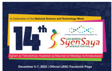
Ang pagdiriwang ng ika-14 na Los Baños SyenSaya Science Festival.

Nakiisa ang LARC sa Los Baños Science Community Foundation Inc. (LBSCFI) noong ika-5 hanggang 7 ng Disyembre sa paggunita ng ika-14 na SyenSaya: The Los Baños Science Festival. Ito ay ang taon-taong pagdiriwang sa pangunguna ng LBSCFI. Ang LBSCFI ay naitatag noong 1984 ng sampung pampubliko at pribadong institusyon at ngayon ay mayroon na itong 25 miyembro kabilang ang LARC.