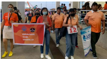
LARC participating in walk for a cause, fight against Violence Against Women.

LARC expressed support to the local government of Los Baños in "Orange the World: VAW-free Community Starts with Me", an 18-day national campaign to fight Violence Against Women (VAW) that began November 25 and until December 12. The support was conveyed by putting up tarpaulins in the office lobby at Maahas, Los Baños.